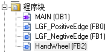
图 2.1.1 程序库

其中，LGF_PositiveEdge 和 LGF_NegativeEdge 由 HandWheel 调用，无需单独调用。