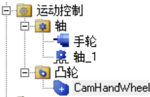
图 2.1.2 组态配置

使用该库前需要配置一个编码器轴和一个 PTO 轴，并设置一个单一直线的凸轮，配置如下：